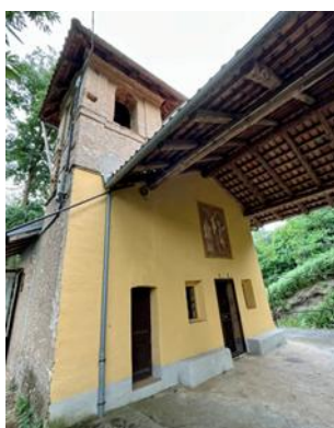
Cappella di San Bernardo

Dalla parte opposta dell'abitato, percorrendo via Bellini per circa 2 km (circa 400 metri dopo il rifugio per animali selvatici "Animal Bosco"), si incontra la Cappella di San Bernardo : l'area su cui sorge è stata ricavata su uno spiazzo a lato della strada, pavimentata in cemento armato e cintata da un parapetto in metallo.