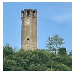
Torre di Brondello

Sulla sommità della collina svetta la Torre , usata per il collegamento a vista con gli altri castelli del Marchesato di Saluzzo: insieme alle rovine delle mura quadrangolari, è quanto resta dell'antico maestoso fortilizio documentato nel 1174, danneggiato durante la guerra tra i marchesi di Saluzzo e i Savoia; la torre venne poi parzialmente restaurata nel 1858, quando fu rifatta la parte sommitale aggiungendo la copertura con alti merli a coda di rondine, l'orologio e la copertura.