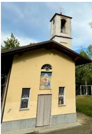
Cappella della Madonna delle Grazie

Lungo la provinciale SP180 che conduce verso la collinetta di Isasca, a circa 3 km dal centro del borgo, si trova la cappella della Madonna delle Grazie : l'edificio in pietra intonacata, a pianta rettangolare, è cintato da una bassa cancellata.