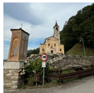
Ponte romano e Pilone

All'imbocco del ponte è collocato il Pilone , decorato con un interessante affresco ottocentesco del pittore locale Giovanni Borgna raffigurante la Madonna con Bambino sulla facciata rivolta verso la strada, l' Ecce Homo sulla facciata laterale destra e san Domenico sulla facciata laterale sinistra.