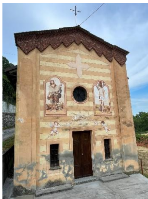
Cappella dei Santi Rocco e Sebastiano

La Cappella dei Santi Rocco e Sebastiano accoglie i viaggiatori all'ingresso dell'abitato, lungo la provinciale SP47 : la struttura, a pianta rettangolare, è in muratura di pietra intonacata, particolarmente semplice.