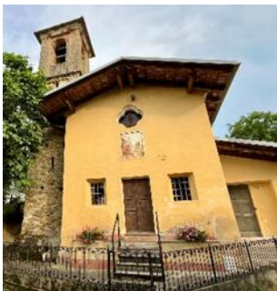
Cappella di San Giuseppe

In frazione S. Antonio, a circa 1 km dall'abitato, risalendo via Rossi si raggiunge la cappella di San Giuseppe , in posizione leggermente rialzata rispetto alla strada: vi si accede attraverso una scala in cemento armato che conduce al piccolo sagrato antistante, protetto da una bassa recinzione. L'edificio a pianta rettangolare si articola in navata principale, coperta da volta a botte, e locale sacrestia.