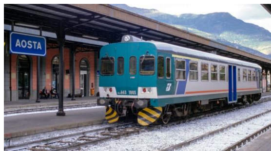
La ALn 663