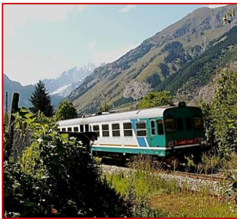
La "ALn663" in arrivo a Morgex

Ora ci attendono un breve tratto ferroviario di quattro chilometri ed una tranquilla passeggiata di una decina di minuti che ci porterà, scavalcando con un ardito