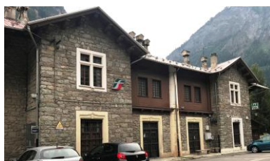
Pré Saint Didier