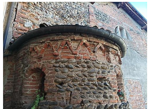
Sizzano – Chiesa di San Grato

Il successivo tratto, come detto brevissimo, ci porta a Sizzano dove, usciti dalla stazione, percorriamo via Ludovico il Moro e svoltiamo in via Mazzini per giungere in pochi minuti alla Chiesa di San Grato , di cui ammiriamo l'abside esterna del XII secolo con tracce di muratura in ciottoli a lisca di pesce, mentre all'interno la zona absidale mostra ancora tracce di affreschi, tra i quali un Cristo benedicente in mandorla ed una Natività. Proseguendo nella via in cinque minuti si raggiunge la chiesa Parrocchiale di San Vittore con tracce di affreschi paleocristiani ed epigrafe che attestano l'esistenza del Pagus Agaminus, da cui Agamium l'antico nome del paese.