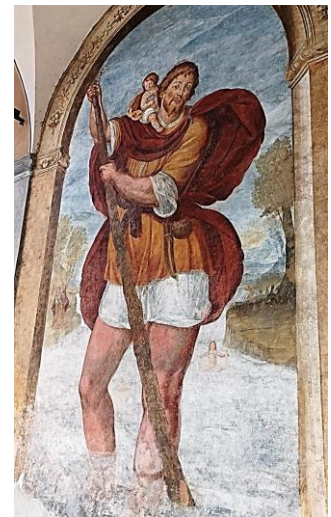
Quarona – Chiesa di Sant’Antonio Abate – San Cristoforo

Risaliamo il corso del Sesia per arrivare a Quarona . Usciti dalla stazione, cento metri a destra, vi è la Chiesa della Beata Panacea al Piano , dedicata a Panacea Muzio. Sepolta come detto a Ghemme è morta quindicenne per mano della matrigna che la rimproverò in modo violento uccidendola forse involontariamente tanto che vedendola morta si gettò in un burrone. La tradizione vuole che la Chiesa sia sorta nel luogo in cui i buoi, che trainavano il carro funebre, si arrestarono rifiutandosi di proseguire. I dipinti sulla facciata sono di Lorenzo Panacino da Cellio. La passeggiata prosegue per meno di mezzo chilometro per raggiungere la parrocchiale di Sant’Antonio Abate . All’esterno vi è un pronao con archi sostenuti da quattro colonne, la facciata presenta affreschi seicenteschi di Sant’Antonio Abate, San Cristoforo, Sant’Antonio da Padova e una Annunciazione. All’interno ammiriamo un affresco della Beata Panacea di fine Quattrocento. Dello stesso periodo è il gruppo ligneo dipinto del Compianto e un affresco della Madonna col Bambino della scuola di Gaudenzio Ferrari . Corso Pietro Rolandi e via XX Settembre ci permettono, in cinque minuti, di tornare al nostro nero e fumante mezzo di trasporto per spostarci a Roccapietra , che dista soltanto quattro chilometri dalla meta.