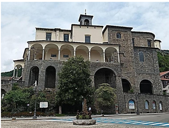
Varallo – Collegiata di San Gaudenzio

Appena ripartiti ci infiliamo in una galleria, superiamo il torrente Pescone ed in tre chilometri giungiamo alla destinazione finale. La stazione è nei pressi della Chiesa di San Marco . All'esterno è ancora visibile un affresco di San Cristoforo mentre all'interno è riccamente dipinta con affreschi del Luini che ritraggono