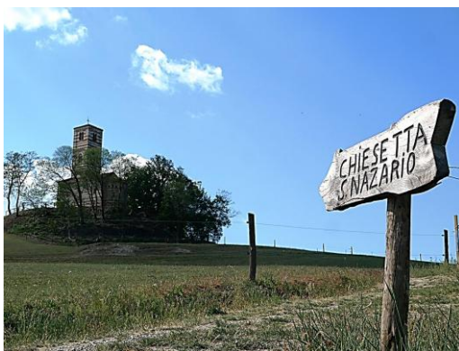
Montechiaro d'Asti - Chiesa di San Nazario

Superata la stazione di Serravalle la seconda sosta avviene nella stazione di Settime – Cinaglio – Mombarone . Anche in questo caso ci serviremo della bicicletta per salire nell'abitato di Settime, dove presso il bar-ristorante potremo ritirare la chiave della chiesa di San Nicolao del XII secolo, posta presso il cimitero. In essa ammireremo all'esterno l'abside con archetti pensili e figure scolpite ed all'interno una sorridente Madonna del Latte e un San Giovanni Battista. Restituita la chiave proseguiamo in direzione Cinaglio alla volta della chiesa di San Felice. La app "Chiese a porte aperte" ci permette di entrare ed ammirare un Cristo Pantocratore in mandorla nel catino absidale, mentre all'esterno sono visibili archetti pensili che decorano la muratura in mattoni. L'agevole discesa ci riporta alla stazione dalla tripla titolazione e ripartiamo. Il tempo per riposare è breve perché dopo pochi chilometri ci attende la stazione di Chiusano - Cossombrato . Raggiungere la Pieve di Santa Maria non richiede particolari sforzi: un breve tratto sulla pianeggiante SP35 e pochi metri di