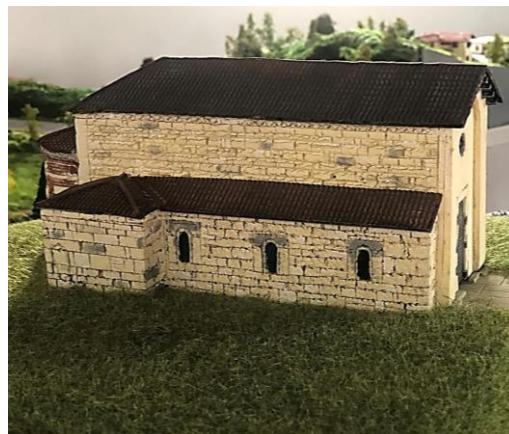
Montiglio Riproduzione della chiesa di San Lorenzo

San Lorenzo . Dopo aver ammirato gli archetti ed i peducci che la decorano esternamente possiamo, utilizzando la app menzionata per visitare la chiesa di Cinaglio, entrare e gustarci la visione degli stupendi capitelli, mai ripetuti, che ornano le colonne. In occasioni particolari, ad esempio le manifestazioni Golosaria o Fiera del Tartufo, è possibile salire al Castello e visitare la Cappella di Sant'Andrea che, posta all'interno del suo parco, è di proprietà privata. Tornati alla